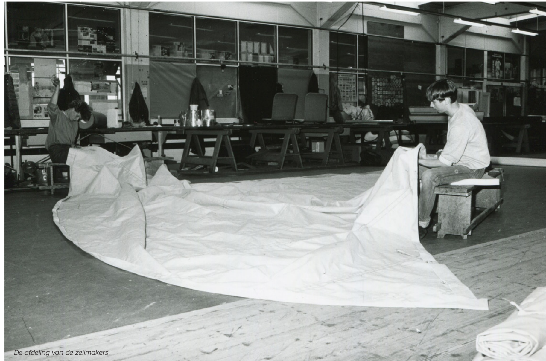
De afdeling van de zeilmakers.