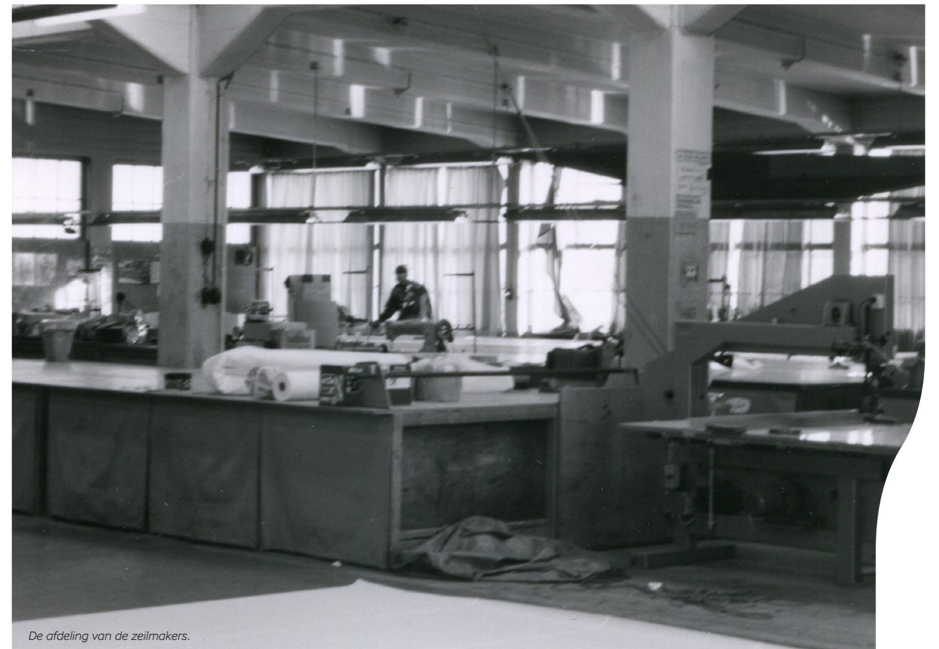
De afdeling van de zeilmakers.