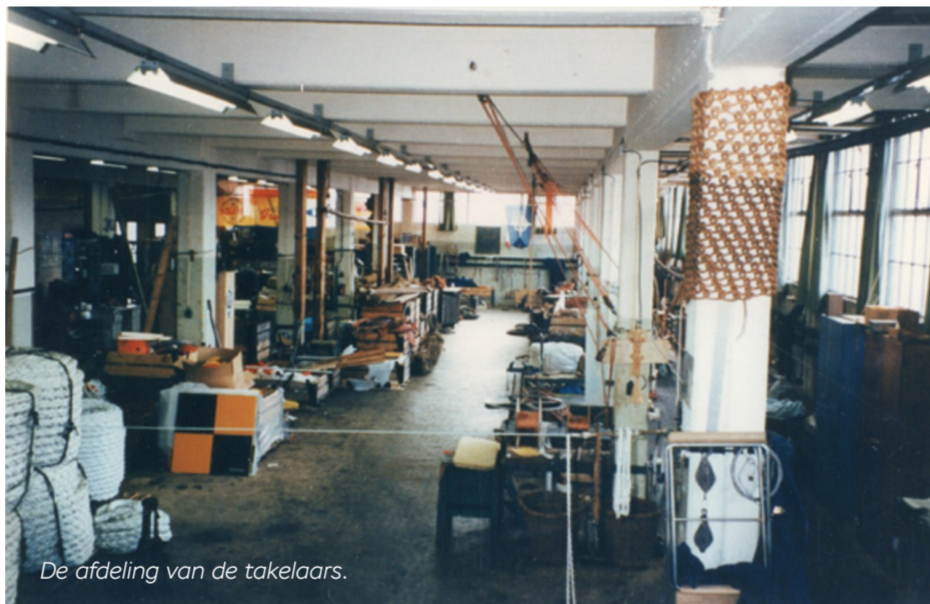
De afdeling van de takelaars.

DE ZEILMAKERS, DE ISOLEERDERS EN DE TAKELAARS: IN GEBOUW 72 WERKTEN VROEGER VEEL AMBACHTSLIEDEN. ZE MAAKTEN ZEILEN MET NAALD EN DRAAD EN DE TOUWSLAGERS VERVAARDIGDEN DE TUIGAGES VOOR DE SCHEPEN. EEN FOTOGRAFISCHE TERUGBLIK NAAR VERVLOGEN TIJDEN.