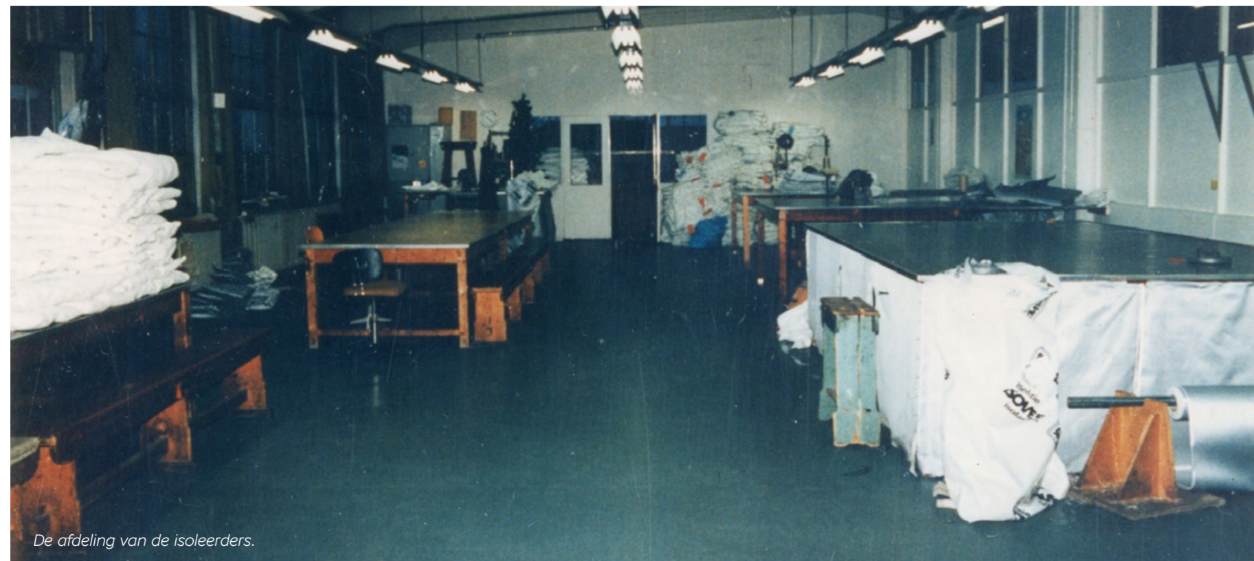
De afdeling van de isoleerders.